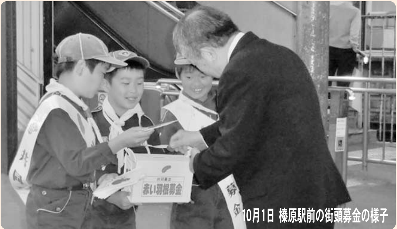
10月1日 榛原駅前の街頭募金の様子