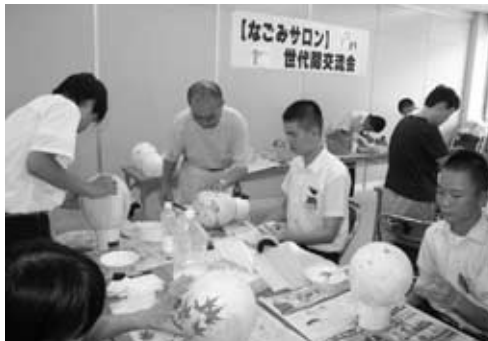
9月7日 宇陀市農林会館において 交流会の様子

風船をふくらませて、その上にボンドをぬり、ティッシュペーパーを重ね、途中木の葉や草木を入れてかざりをします。そして、ボンドが固まったら風船を割って取り出すと、風船の形になったランプシェードの出来上がり。電気をともすととてもきれいでした。