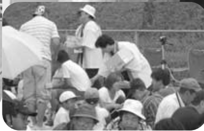
【菟田野区】菟田野小学校運動会